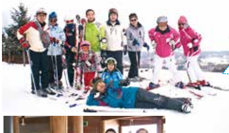
白銀の世界 で リフレッシュ！

滑ったあとは温泉に入り、降り積もる雪を眺めながら食事する優雅なひとときが待っています。ときには仕事を忘れて、銀世界で楽しみましょう！